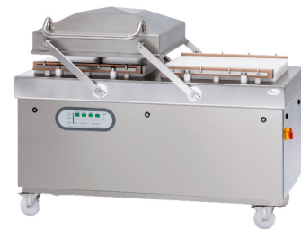
TITAN X 630 S