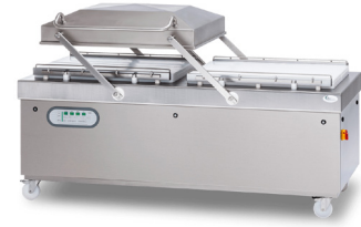
TITAN X 950