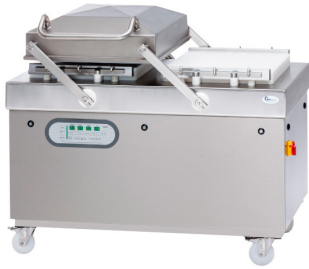
TITAN X 480