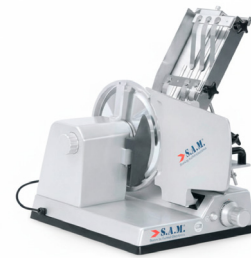
Manual 300 salmón