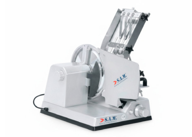
Manual 300 salmón