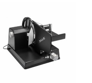
300 XXL negro