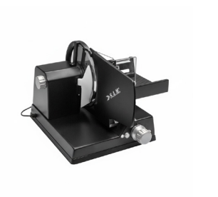
300 XXL negro