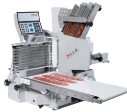
308 iB Salami