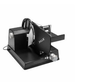
300 XXL negro