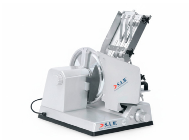
Manual 300 salmón