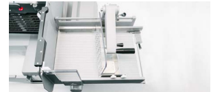
imatic 270 mm x 350 mm