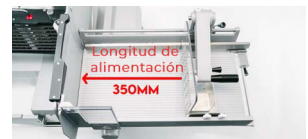
imatic 270 mm x 500 mm