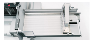
imatic 270mm x 650 mm