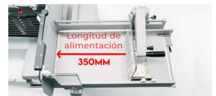
imatic 270 mm x 500 mm